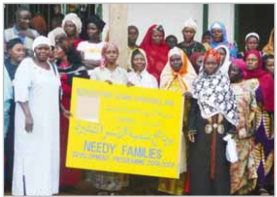
عدد من المستفيدات الأفريقيات من برنامج الهيئة الخيرية