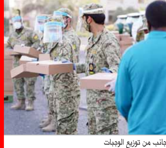
جانب من توزيع الوجبات