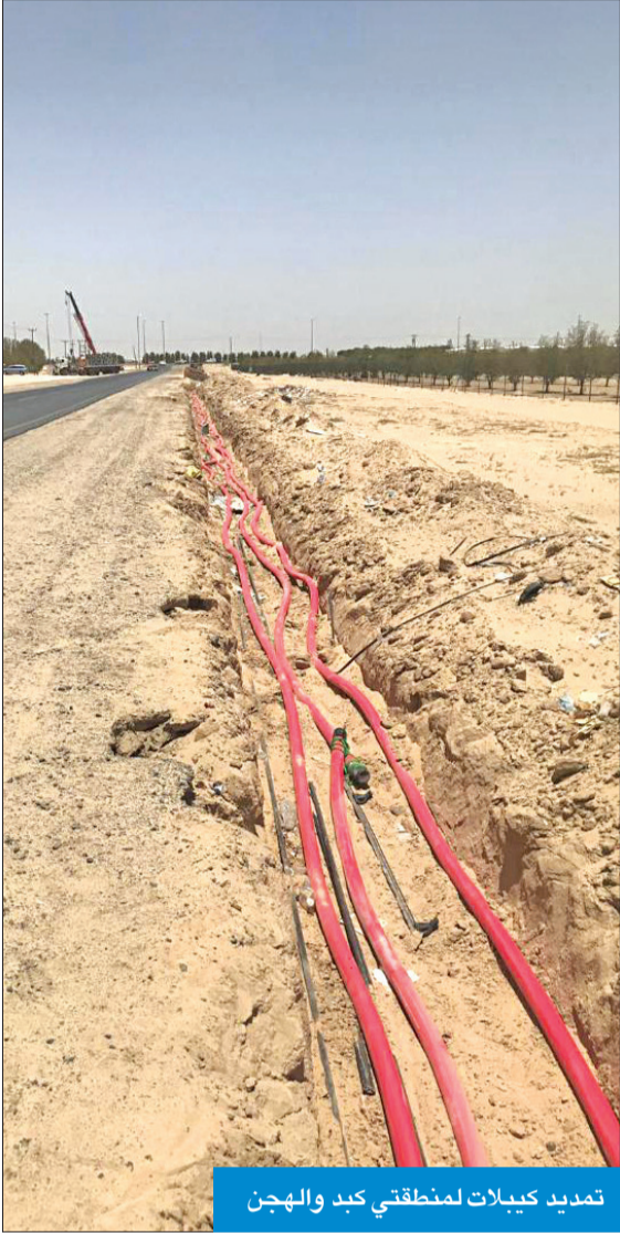
تمديد كيبلات لمنطقتي كبد والهجن