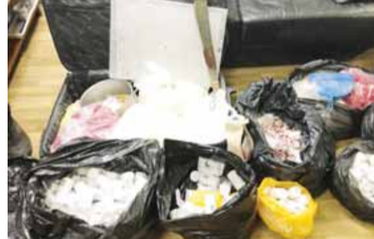
المواد المخدرة المضبوطة